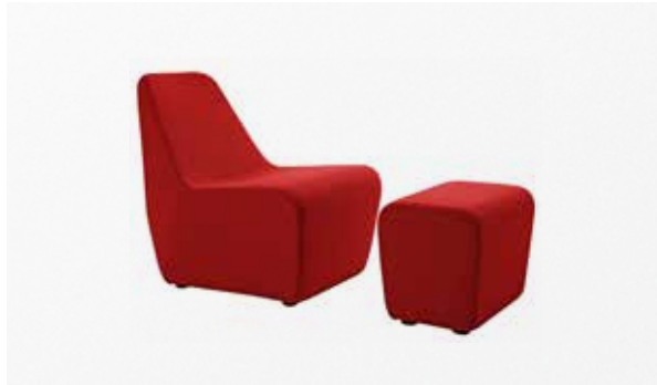
SOFT LOW SMALL