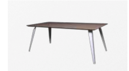
SEUREN SPIKE *