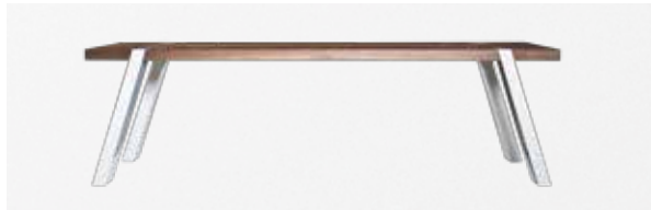
SEUREN GULLIVER SPAGAAT *