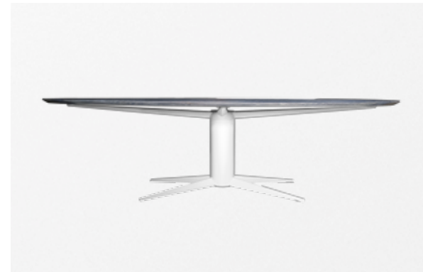
SEUREN JUMP *